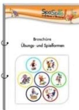
Broschüre (DIN A5)