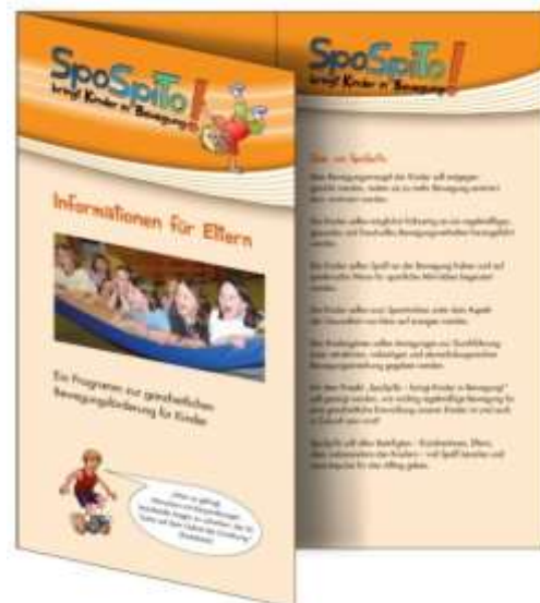
Informationsflyer für die Eltern (DIN lang)