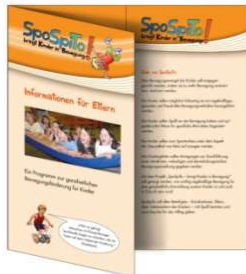
Informationsflyer für die Eltern (DIN lang)