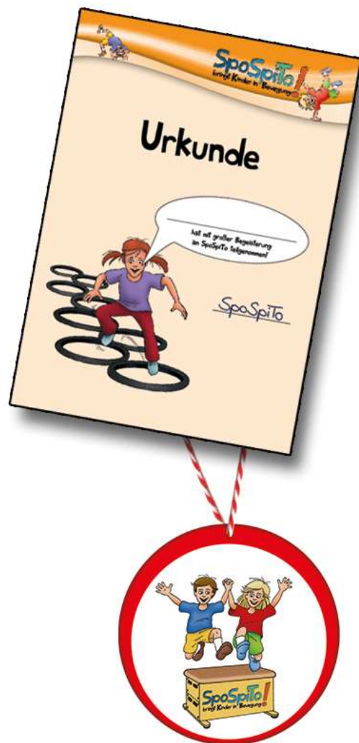
Urkunde (DIN A4) und Medaille