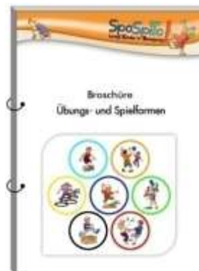
Broschüre (DIN A5)