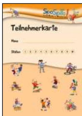
Teilnehmerkarte (DIN A5)