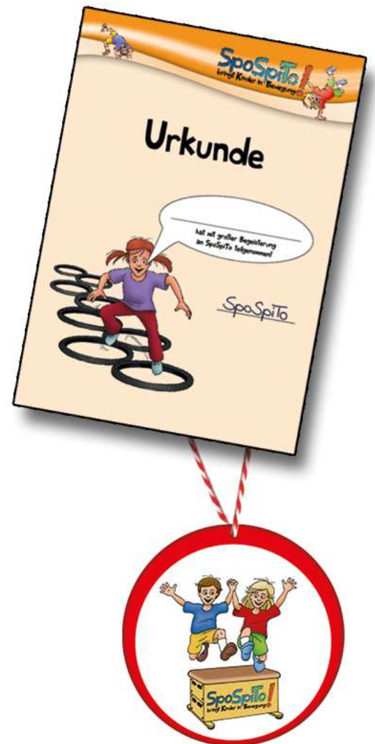
Urkunde (DIN A4) und Medaille