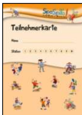
Teilnehmerkarte (DIN A5)