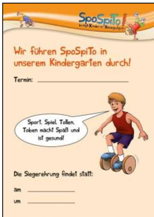
Ankündigungsplakat (DIN A3)