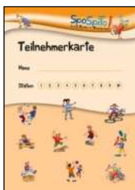
Teilnehmerkarte (DIN A5)