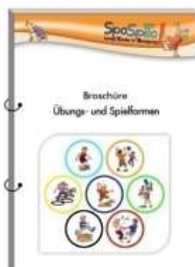
Broschüre (DIN A5)