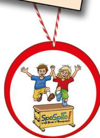
Urkunde (DIN A4) und Medaille