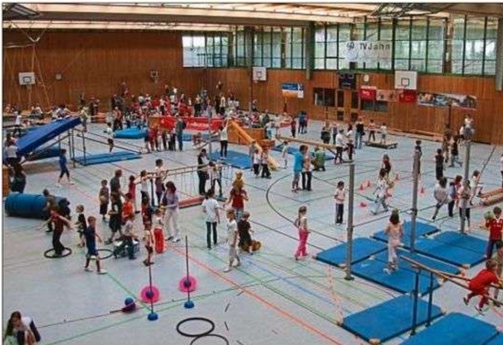
An zahlreichen Spiel- und Sportstationen können sich die Kinder am kommenden Samstag so richtig austoben.

Weitere Informationen zu der Veranstaltung gibt es auch unter www.spospito.de . kb