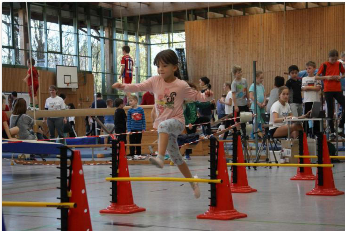
Laufen mit elektronischer Zeitmessung: Das ist eine der Attraktionen beim großen Kinderaktionstag des TV Memmingen.