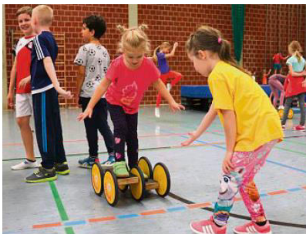
Ein toller Erfolg war der bereits zum sechsten Mal vom TV Memmingen durchgeführte SpoSpiTo-Tag in der BBZ-Turnhalle.