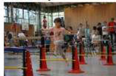
Laufen mit elektronischer Zeitmessung